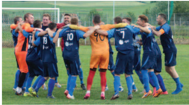
A győztes öröme a pályán

A Székely Kupát az előző idényekben Csíkszereda, Mezőméhes és Harasztkerék hódította el.