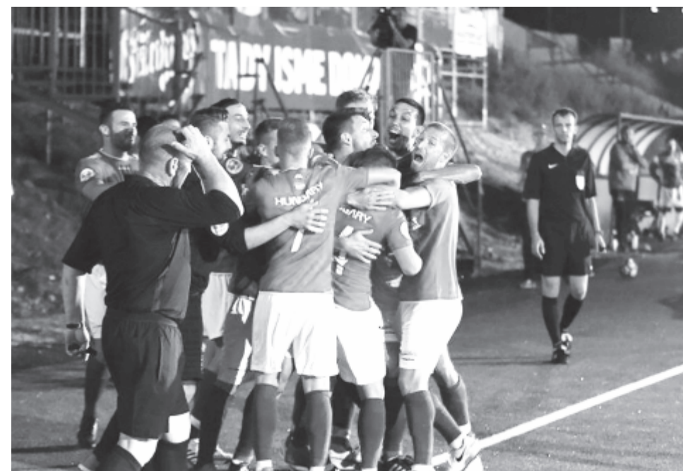
A románokat legyőzve Európa-bajnoki bronzérmes a magyar kispályás labdarúgó-válogatott

* A magyar férfikézilabda-válogatott 35-23-ra győzött Lettország vendégeként az Európa-bajnoki selejtező csütörtöki játéknapján, így az utolsó forduló előtt biztosította kijutását a januári horvátországi tornára. Románia 32-22-re kikapott Fehéroroszországtól, így