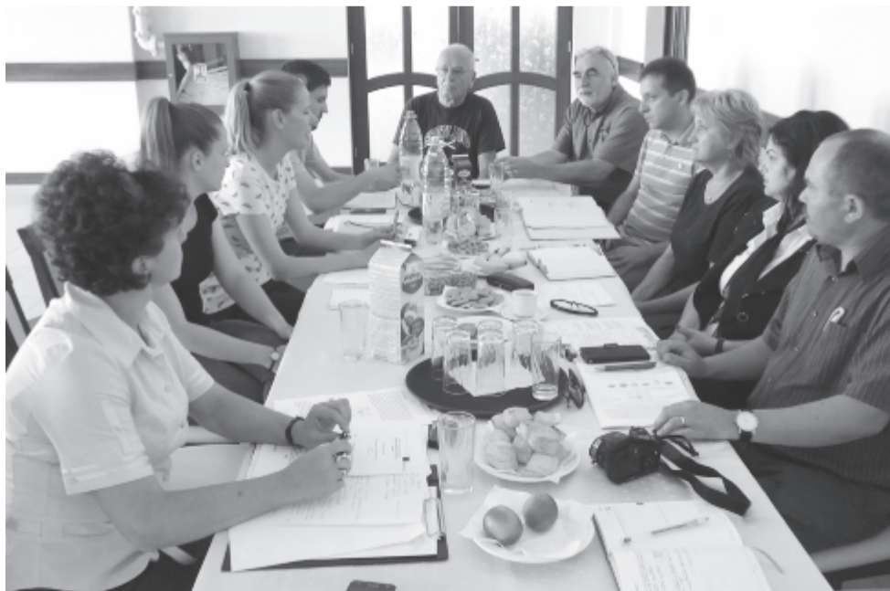
A gálfalviak első ízben házigazdái a műhelymunkáknak