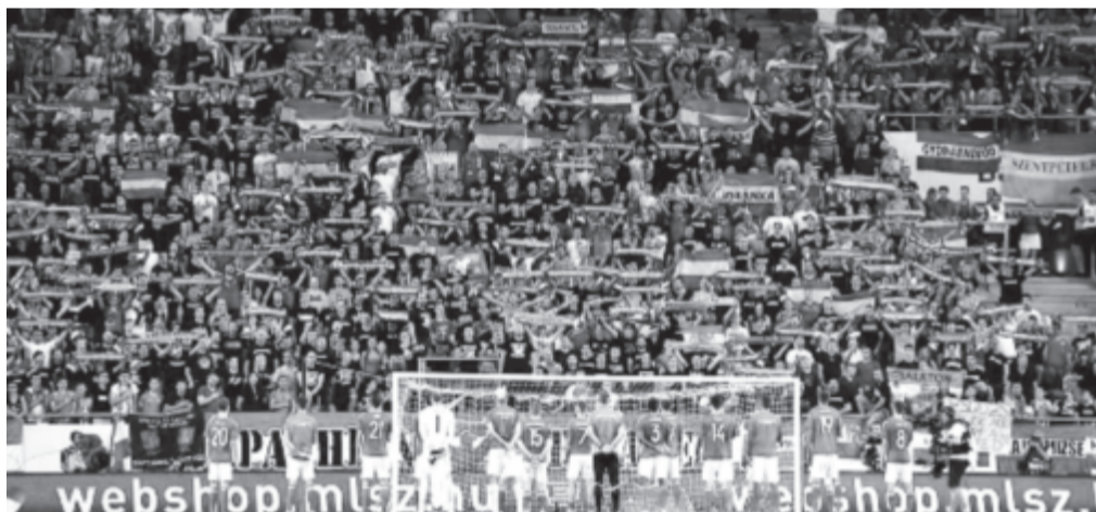
Elsődleges célként tekint a szövetségnek, hogy a szurkolókat újra a magyar csapat mellé állítsa

Bernd Storck, a magyar labdarúgó-válogatott szövetségi kapitánya meghívta a lettek és a portugálok elleni világbajnoki selejtezőre azokat a szurkolókat, akik a helyszínen tekintették meg az andorrai mérkőzést, és bejelentette: ő fizeti a jegyüket.