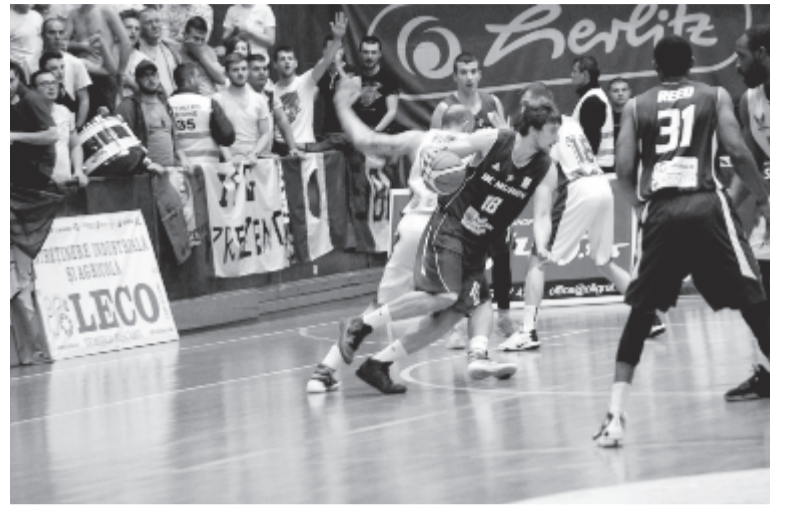
A rájátszás első köre május első felében zajlik, így az első nyolc csapat nem áll meg április végén, mint például az idején is.

A bajnoki idején legfontosabb újdonsága, hogy az idén két FIBA-ablak szakítja meg, novemberben és februárban, miután a nemzetközi szövetség a labdarúgáshoz hasonlóan változtatja meg a nemzetközi tornák, Európa- és világbajnokságok selejtező rendszerét. Ennek legfontosabb következménye, hogy kitolódik az idején vége, a bajnokság döntője (az európai országok többségéhez hasonlóan) Romániában is június